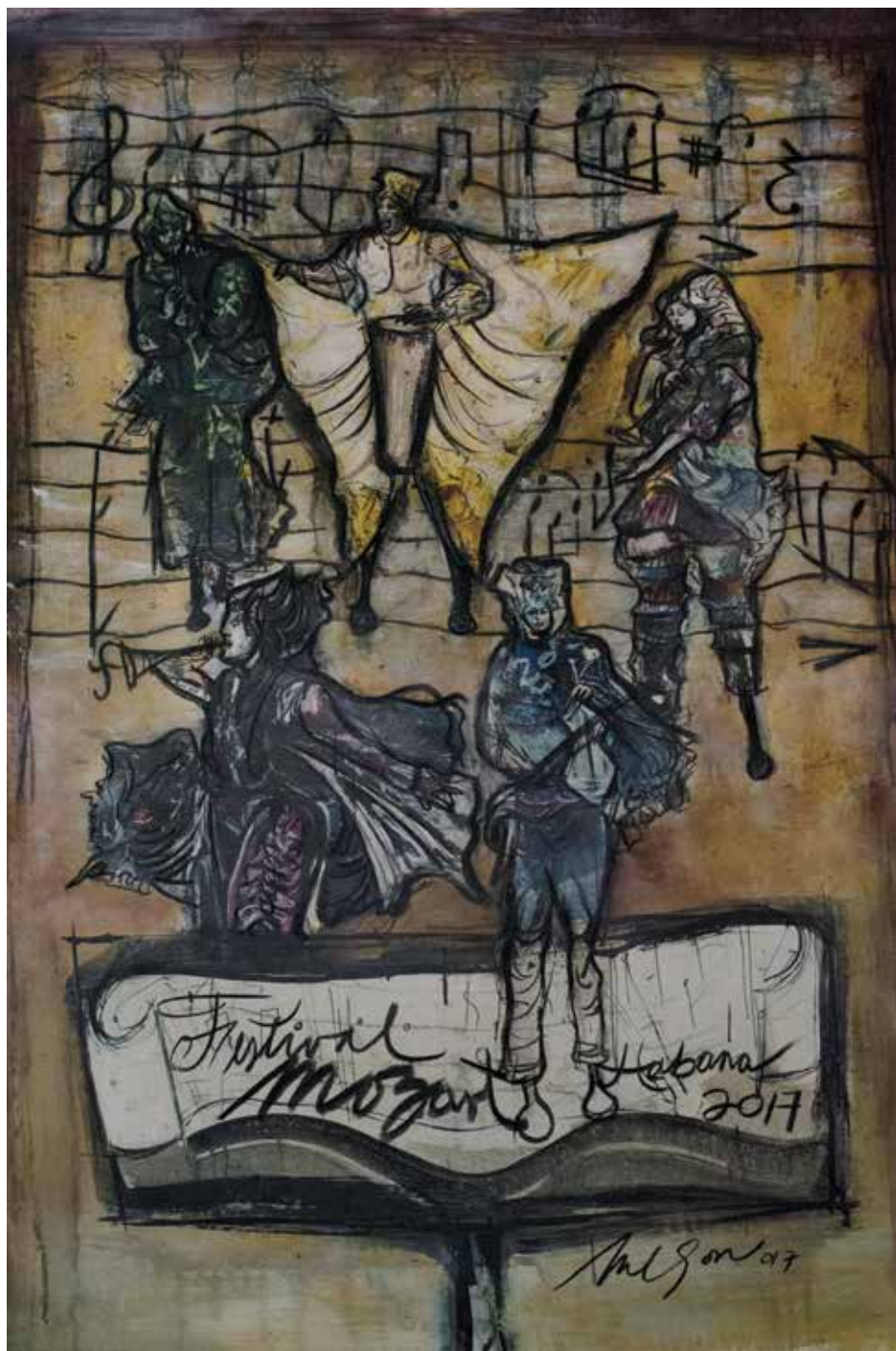
Obra cortesía del artista plástico Nelson Domínguez